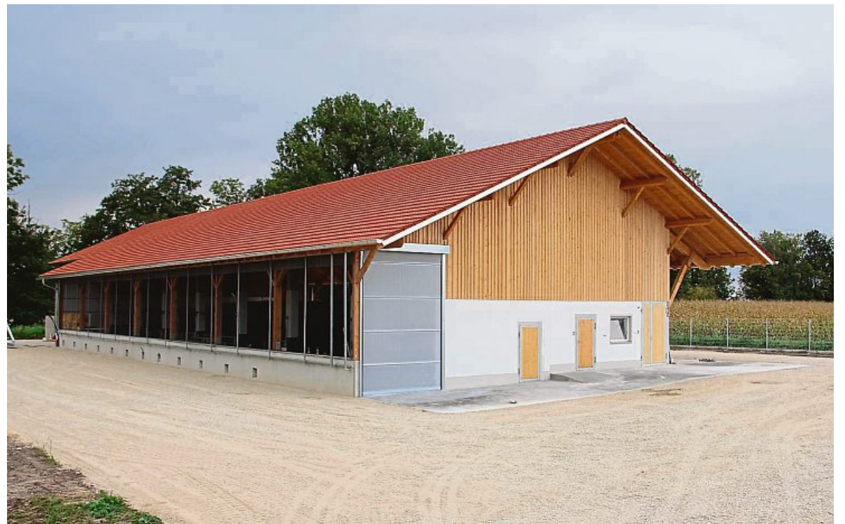
Der neue Stall bietet ein deutlich offeneres Haltungssystem. Durch große Öffnungen ist er lichtdurchflutet und man kann die Schweine auch von außen beobachten.

Für die Tiere entstehen lange Buchten, die jeweils dreigeteilt sind. Im hinteren Bereich gibt es Rückzugsmöglichkeiten. Bei stetig neuem Stroh können die Schweine dort deutlich bequemer als bisher ruhen und schlafen. Durch einen Lamellenvorhang abgetrennt geht es in den Aktivitätsbereich mit den Futtertrögen, die immer Nahrung bieten. Dank eines Gefälles von rund zwei Prozent wandern dabei Teile des Strohs mit. „Damit spielen die Tiere sehr gerne und können so ihren natürlichen Wühltrieb ausleben“, betont Ludwig Aigner.